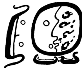
Figura. 1. El glifo u way (su coesencia animal) tomado de una vasija policroma de proveniente de la Tumba 9 de Río Azul Guatemala. (Dibujo de Eduardo Puga 2016)

Conclusión. La noción del way que se ha manejado durante siglos, es la de ser entidades ambiguas que a veces actúan de manera benévola con los que los seres humanos tienen que congraciarse a cambio de recibir su protección, mientras que en otra se transmutan en seres malignos capaces de causar enfermedades a las personas e incluso la muerte. Recientes investigaciones en el ámbito etnográfico, iconográfico y epigráfico, han cambiado la visión de la forma en que por mucho tiempo los wayes fueron concebidos dentro de la visión cosmogónica de los mayas, evidenciando que los animales son seres con un instinto de supervivencia traducido en una gran sensibilidad que les hace actuar de determinadas maneras, estas conductas fueron leídas por los mayas considerándolas como producto de poderes sobrenaturales (Tuz 2014), razón por la cual muchos de ellos fueron considerados como coesencia protectoras que compartían el destino de sus protegidos.