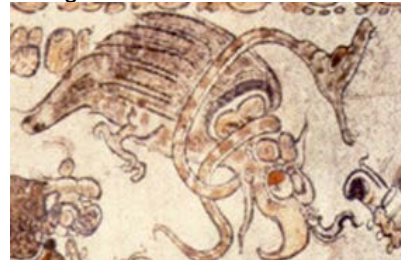
Figura 2. Tahn Bihil Chamiy. K791.