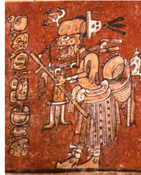
Figura 1. a ‘U K’uh Chij Chamiy. K2023. Fotografía de Justin Kerr

Conclusion: Con esto encontramos que la taxonomía de wahyis entre los mayas es muy flexible, pues las categorías de abarcan seres animales, enfermedades, alegorías e incluso fenómenos meteorológicos por lo que puede lograrse una clasificación pero lo importante es recordar que estos seres habitaban los sueños y su apariencia podía cambiar sobrepasando cualquier taxonomía.