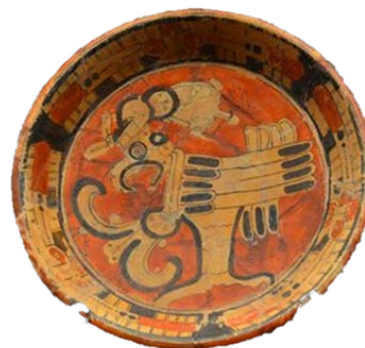
Fig. 2 Plato decorado con un ave moan. Xcambó, Yucatán. Clásico Tardío. Centro INAH Yucatán.