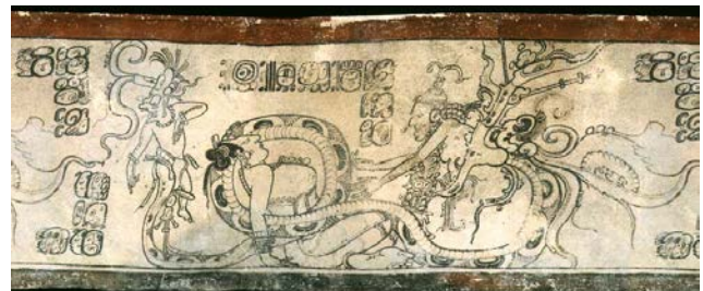
Figura 1. Ahkan saliendo de una Serpiente sobrenatural, escena con mujer joven y Kawil. Lietratura

mayoría este acto sobrenatural ocurre en interiores de cuartos, aunque también en menor número parecen ser contextos sobrenaturales. Las actitudes que se denotan mayormente son aquellas donde el akán muestra expresiones de posibles actos sexuales hacia las jóvenes. ¿acaso estas representaciones de sexualidad para los mayas prehispánicos del periodo Clásico Tardío eran comunes de ver más allá de las imágenes, es decir eran socialmente aceptadas entre los ancianos y las jóvenes? La muestra empleada son materiales propios de las clases más privilegiadas, por lo que hay que considerar que estos grupos marcaron la idealización de la vejez entre la elite, aunque no hay que descartar que también pudo haber sido lo que las clases menos privilegiadas consideraban de la ancianidad a través de los akanes.